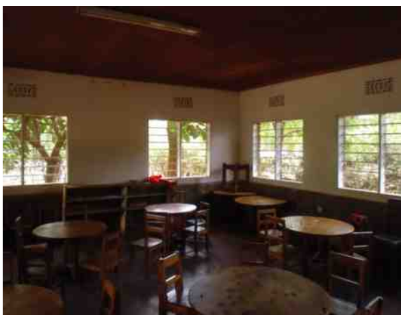
Das Klassenzimmer vor der Renovierung