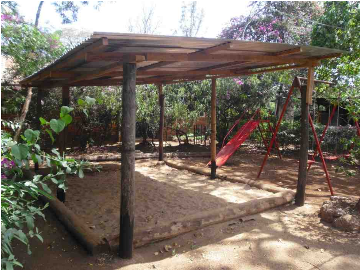
Das Dach ist nun drauf und spendet wohlthuenden Schatten