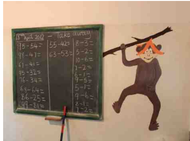
Die heimische Tierwelt findet sich in der Baby-, Bananen- und auch in der Apfelklasse