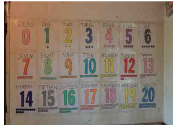
..... und mit den neuen Alphabeth- und Zahlentafeln geht das Lernen viel einfacher