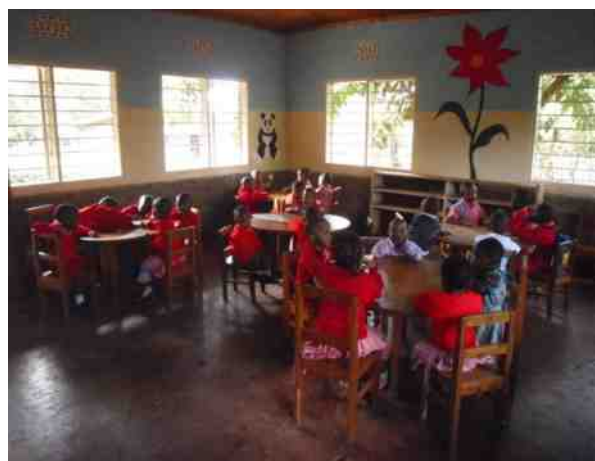
und nach der Renovierung, hell, kindgerechte Motive