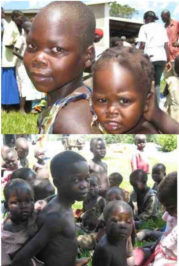
Students help Students – One World

Wir freuen uns die Band Auletta als Botschafter unserer Idee willkommen zu heißen.